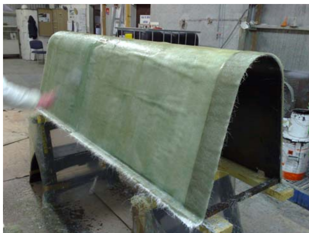
Application de la dernière couche de résine