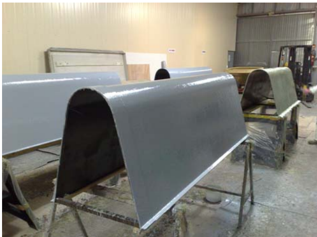
Application du Gelcoat polyester

Fabrication au contact sur moule correspondant au gabarit de l'ouvrage à réhabiliter.