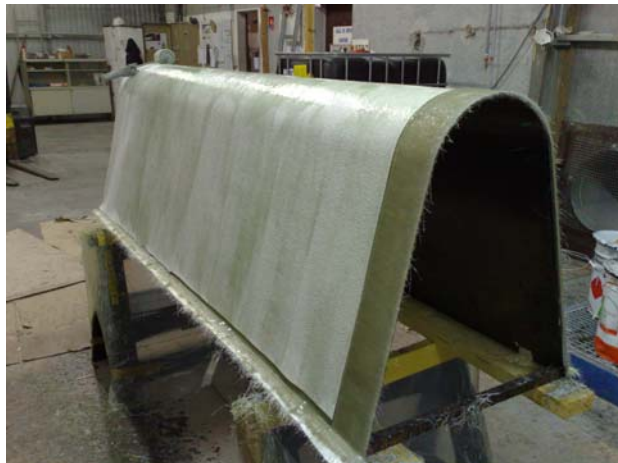
Application de la résine et du feutre microsphères