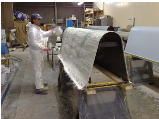
Application des couches de fibres de verre